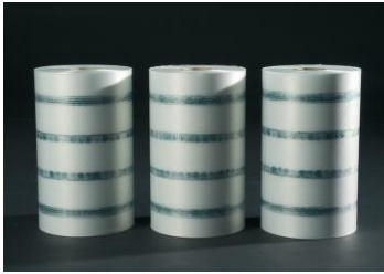
Standaard folie FROMM