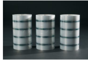
Multilayer folie (MLF) FROMM