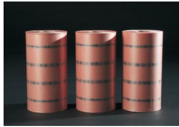
Antistatische folie FROMM