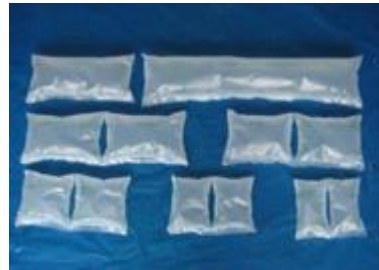
Vershillende model of luchtkussens