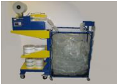
Trémie de stockage des coussins d'air