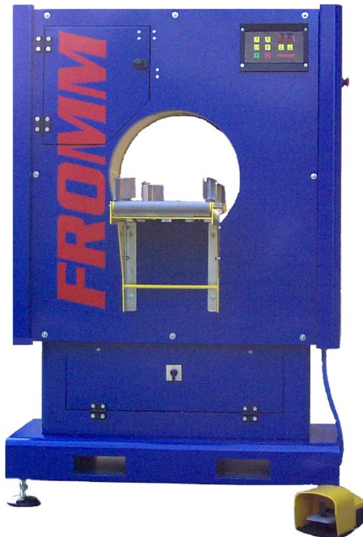
Easy Wrap™ FV205 Banderoleuse verticale Semi automatique