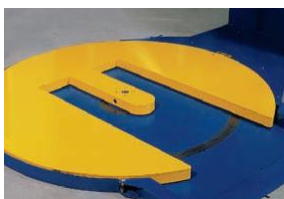
Draaietafel in hoefijzervorm, gemakkelijk te beladen met een palletwagen. Uitgevoerd met voetbeveiliging