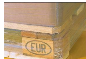
Lage onderwikkeling op draaietafelniveau