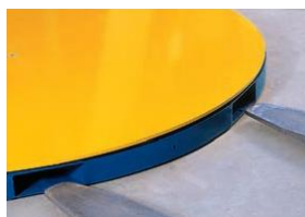
Gemakkelijk te verplaatsen met behulp van een heftruck