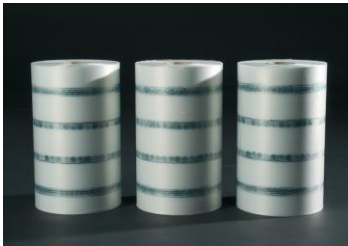
Standaard folie FROMM