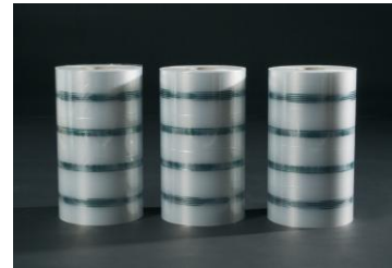
Multilayer folie (MLF) FROMM