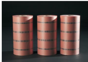
Antistatische folie FROMM