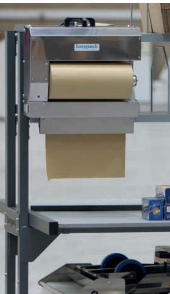
Système freestyle™ en option.