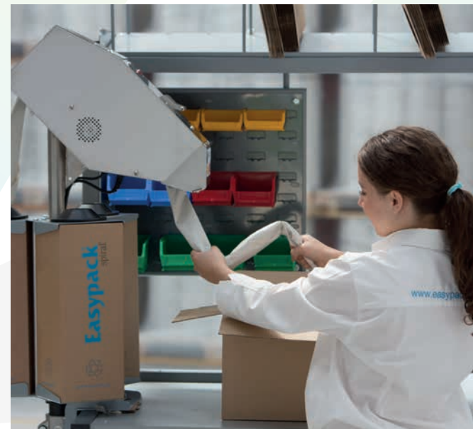
Les systèmes spiral® existent en version manuelle ou électrique.

Un support optionnel monté sur l'étagère vous permet d'installer d'autres systèmes d'emballage en toute sécurité, comme le système freestyle™ qui distribue des feuilles de papier sur demande, pour envelopper ou caler les marchandises directement dans la boîte. Une fixation sur le plan de travail est également disponible pour installer aisément un distributeur spiral® ou une machine spiralpro® sur la packstation™.