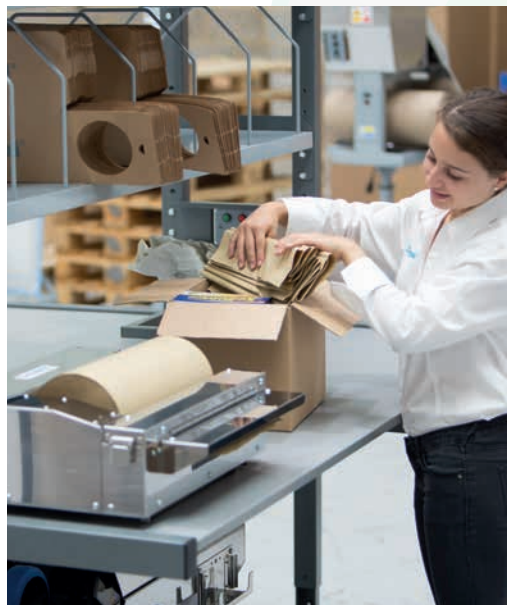
Espace de travail disponible idéal pour intégrer une solution d'emballage complémentaire.