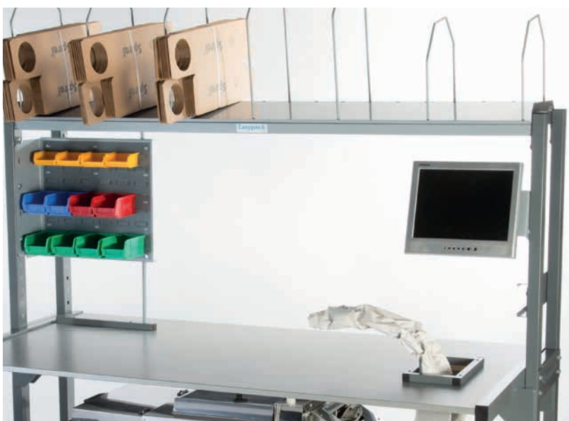
La packstation™ simple poste avec étagère inclinée.

La machine de calage positionnée sous la surface de travail produit des coussins de papier résistants, flexibles et faciles à manipuler, à partir de rouleaux de papier 100% recyclé. Ils sont acheminés par la goulotte directement sur la table de travail pour un usage immédiat et sans stockage. Ce qui vous permet d'emballer une multitude de produits différents en ayant tout à portée de main.