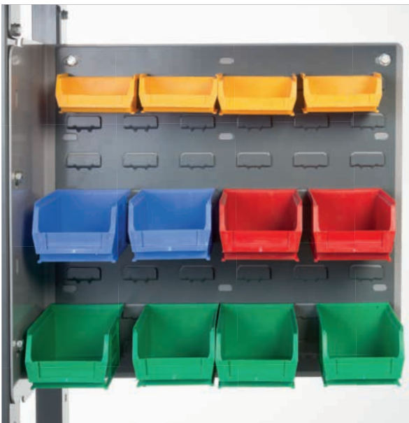
Compartiments de stockage réglables pour les plus petits articles d'emballage.

Les options comprennent des boîtes de stockage supplémentaires pour les petits articles d'emballage, un support d'écran totalement réglable et un bloc de prises secteur 230V idéalement positionné afin de connecter les équipements auxiliaires.