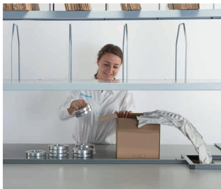
La packstation™ double poste permet à plusieurs utilisateurs de travailler efficacement face à face.