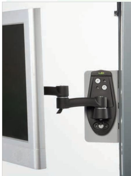
Support d'écran réglable.