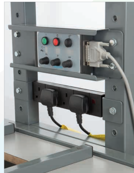
Bloc de prises 230V.

“ La packstation™ est un système ergonomique conçu pour le confort et l'efficacité ”