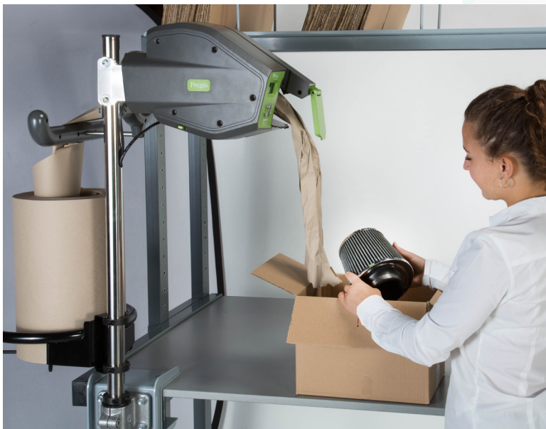
Plaats aan werkstation voor meer gebruiksgemak en comfort.