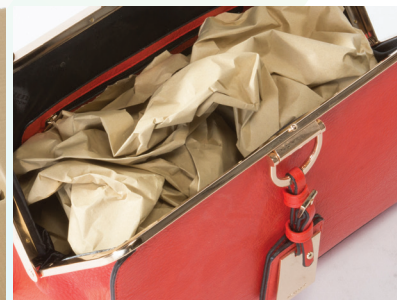
Duurzame papieren ruimteopvulling is schoon, flexibel en licht van gewicht.

Quantum™XT levert 100% gerecycled papier met snelheden van maximaal 1,8 m per seconde, waarbij volledige controle kan worden gehouden over de gewenste uitvoer om zo tegemoet te komen aan allerlei soorten verpakkingshandelingen.