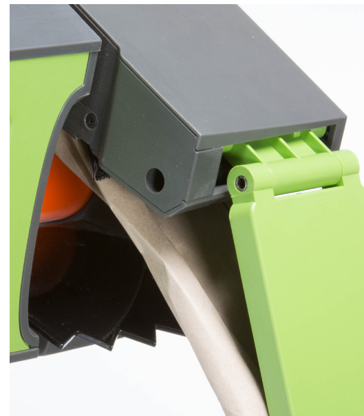
Mesloos afscheursysteem voor veilig en eenvoudig gebruik