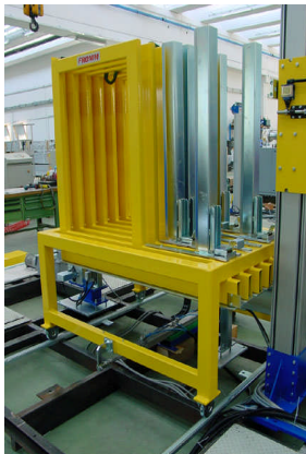
Magasins automatiques pour injection de chevrons

caractéristiques • Technologie spécifique pour l'industrie sidérurgique • Nombreuses références à travers le monde • Tête forte tension MH600 par friction fusion • Robuste et compacte cette machine est prévue pour une intégration facile dans des lignes de convoyage. • utilisation simple du pupitre opératoire tactile avec détail d'utilisation et auto-diagnostic • automate type Siemens