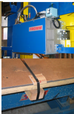
Tête de cerclage forte tension MH600